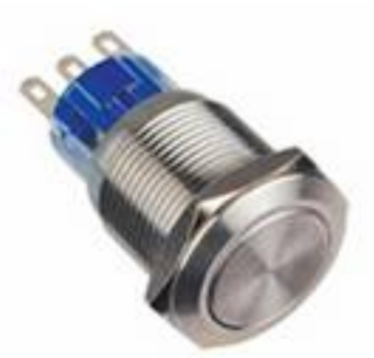
一般按钮&自锁按钮