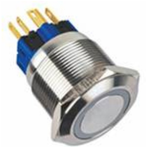
带灯按钮&带灯自锁按钮